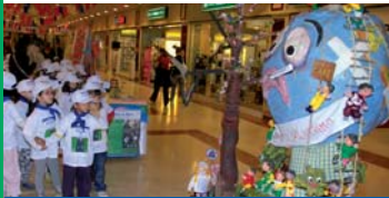
Superpremio "Il mondo malato", Scuola Elementare di Bancali.

Di seguito l'elenco delle scuole premiate (si evidenziano solo i primi premi).