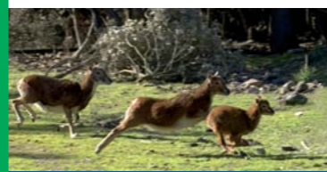
Mufloni, Monte Lerno - Pattada.

VENERDÌ 17 APRILE 2009. MONTE LERNO (PATTADA) DALLE ORE 9:30 ALLE ORE 17:00.