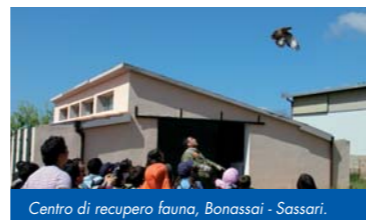
Centro di recupero fauna, Bonassai - Sassari.

(*) In relazione al numero dei partecipanti saranno organizzate più giornate.