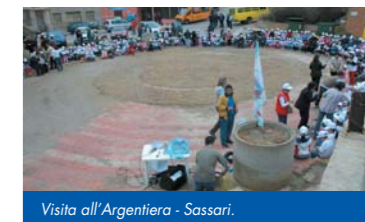
Visita all'Argentiera - Sassari.