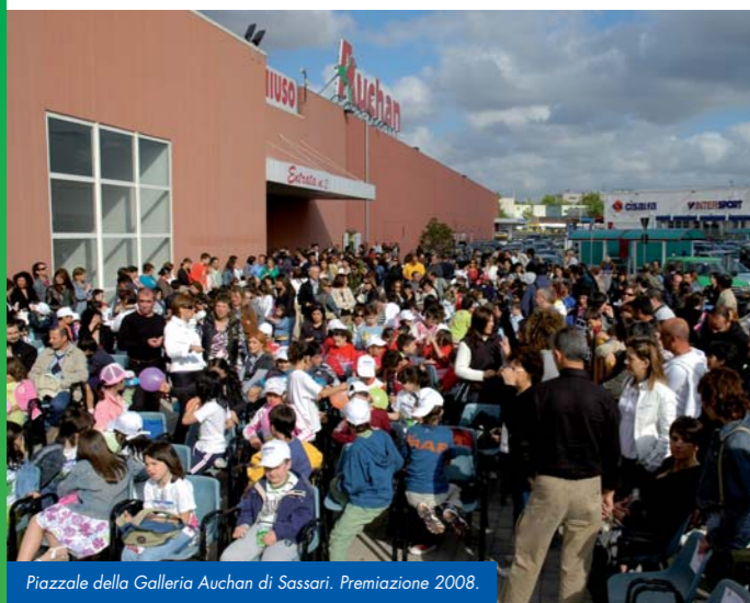
Piazzale della Galleria Auchan di Sassari. Premiazione 2008.

La Galleria Auchan di Sassari promuove e sostiene il progetto Adotta un albero , allo scopo di sensibilizzare gli studenti sardi ed il pubblico in genere sulle tematiche della scoperta del territorio, della protezione dell'ambiente e della conservazione della natura.