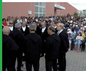
Piazzale della Galleria Auchan di Sassari. Premiazione.

GIOVEDÌ 21 MAGGIO 2009 ORE 10:00. GALLERIA AUCHAN DI SASSARI. Inaugurazione della grande Mostra finale.