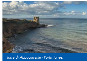
Torre di Abbacurrente - Porto Torres.

NEI GIORNI 6, 7 E 8 APRILE 2009 A PORTO TORRES: