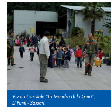
Vivaio Forestale "La Mandra di la Giua", Li Punti - Sassari.

(*) In relazione al numero dei partecipanti saranno organizzate più giornate.