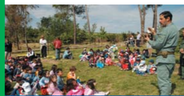
Festa degli alberi, Bunnari - Sassari.

GIOVEDÌ 23 APRILE 2009. PARCO COMUNALE DI BUNNARI. (SS) DALLE ORE 9:00 ALLE ORE 12:00.