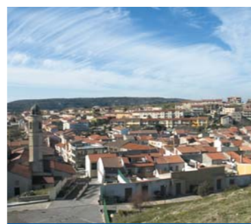
Veduta di Florinas.