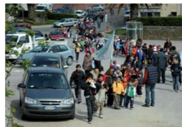
Festa degli alberi Stintino.

VENERDÌ 3 APRILE 2009. BONASSAI (SASSARI) DALLE ORE 9:30 ALLE ORE 12:00.