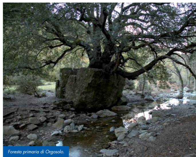
Foresta primaria di Orgosolo.