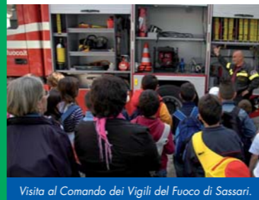
Visita al Comando dei Vigili del Fuoco di Sassari.

In collaborazione con il Comune di Porto Torres (Assessorato all'Ambiente). Partecipazione gratuita.