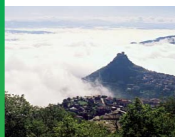
Veduta del Castello di Burgos.

Per info costi attività e pernottamento: tel/fax 079/55.71.476 - cell. 329/74.68.048.