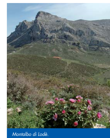
Montalbo di Lodè.