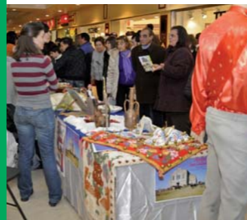
Mostra inaugurale in Galleria Auchan di Sassari.

SABATO 28 FEBBRAIO 2009 ORE 17:30 IN GALLERIA AUCHAN DI SASSARI. Mostra inaugurale del progetto "Adotta un albero 2009".