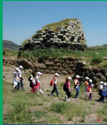
Festa degli alberi - Pozzomaggiore.

LUNEDÌ 11 MAGGIO 2009. PULIAMO IL NOSTRO TERRITORIO. POZZOMAGGIORE DALLE ORE 9:30 ALLE ORE 17:30. Una giornata per scoprire i tesori naturalistici, storici e culturali di Pozzomaggiore e del suo territorio.