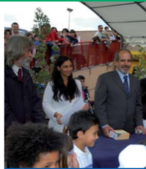
Piazzale della Galleria Auchan di Sassari. Premiazione.

I primi premi e i Superpremi, selezionati dalla giuria, andranno alle scuole più meritevoli, ovvero a quelle che meglio si saranno distinte nell'esecuzione dell'elaborato; un Superpremio andrà all'elaborato più votato dai visitatori internet e un Superpremio premierà la fotografia del docente più votata dai visitatori del WEB.