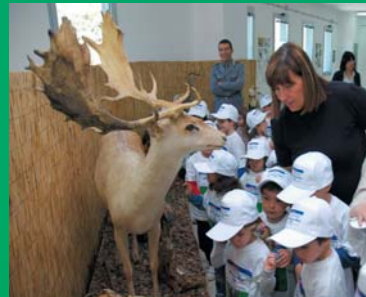
Stazione del Corpo Forestale e di Vigilanza Ambientale - Ripartimento di Sassari.

VENERDÌ 20 MARZO 2009. LU TRAINEDDU (SS) DALLE ORE 9:30 ALLE ORE 12:00.